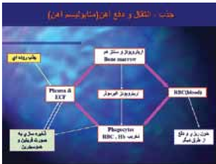
شکل ۱- متابولیسم آهن در بدن

متوسط مصرف روزانه آهن در بزرگسالان ۱۰-۱۵ میلی‌گرم در روز است که از آن ۱-۲ میلی‌گرم توسط انتروسیت های دوازدهه جذب می‌شود. آهن موجود در مواد غذایی سپس متحمل احیای آنزیمی توسط فری ردوکتاز حاشیه بررسی روده باریک شده و با کمک pH پایین معده از آهن فریک ( Fe^{3+} ) به آهن فرس ( Fe^{2+} ) سهل‌الجذب تبدیل می‌شود. انتقال دهنده فلز دو ظرفیتی (DMT1) در اپیتلیوم دوازدهه آهن را از عرض غشای