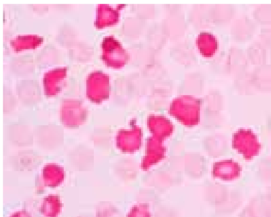
پخش غیر یکنواخت هموگلوبین F در تالاسمی دلتا بتا

آزمایش بتکه که شیوه پخش هموگلوبین F را در گلبول‌ها نشان می‌دهد می‌توان این دو حالت را از هم افتراق داد. در تالاسمی دلتا بتا پخش غیر یکنواخت و در HPFH پخش یکنواخت مشاهده می‌شود.