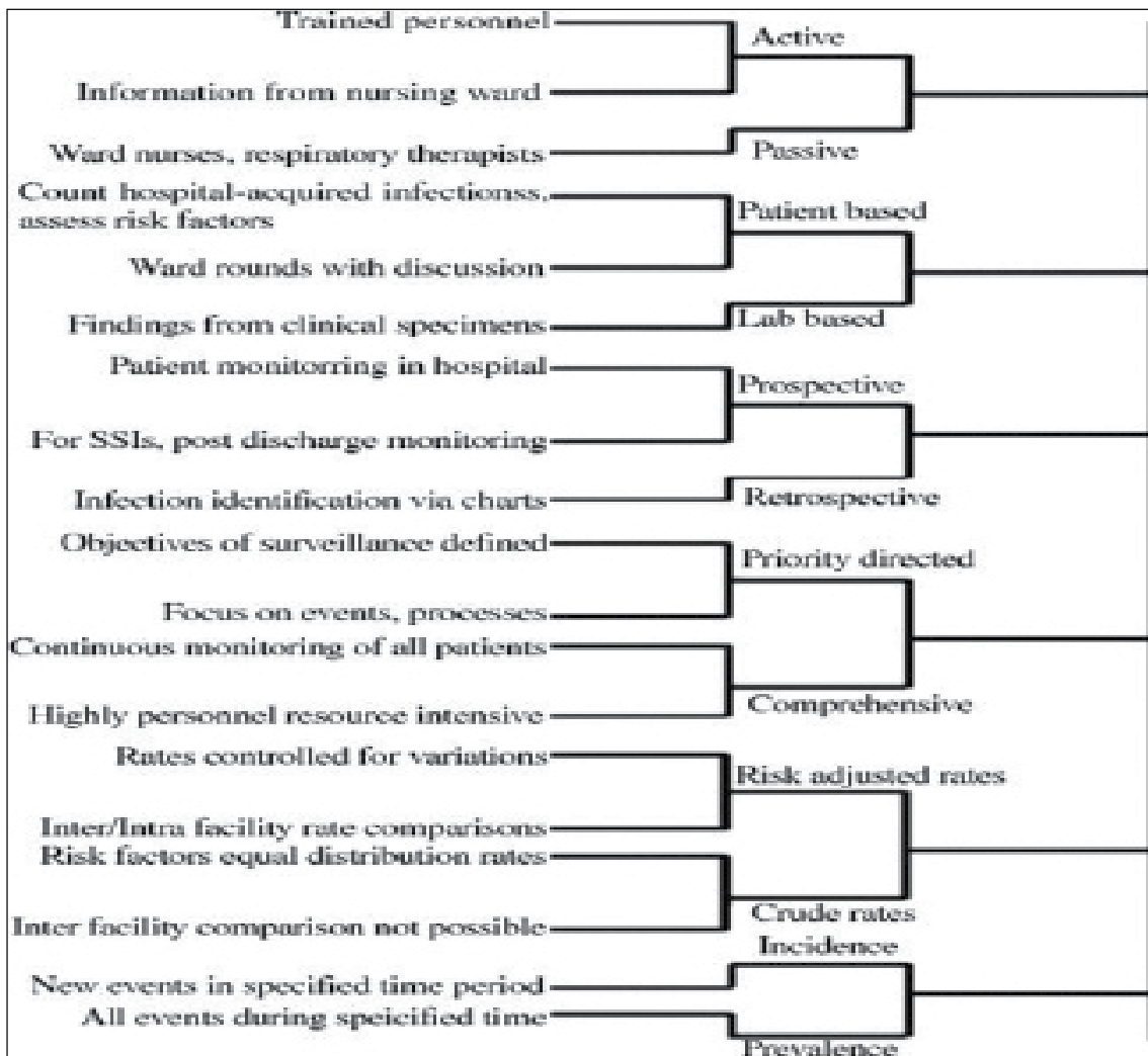
شکل ۲- کارگروه یکپارچه پیشنهاد شده برای نظارت عفونت‌های بیمارستانی در هر بیمارستان