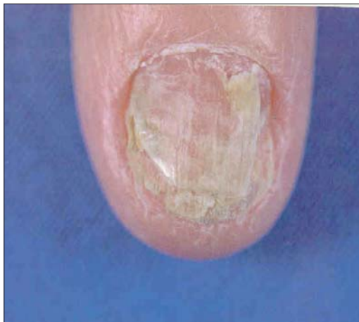
تینا اونگیوم، تشخیص افتراقی با اگزمای مزمن

از بین گونه‌های اسکوپولاریوپسیس گونه برویکالیس ( Scopulariopsis brevicaulis ) عامل دیستروپی ناخن است. این قارچ ناخن‌های سالم را نیز مورد هدف قرار می‌دهد. بعد از این گونه، از نظر فراوانی گونه‌های آسپرگیلوس، آکرومونیوم، و فوزاریوم به ناخن حمله می‌کنند هرچند که آسپرگیلوس و رسیکالر (شامل A. sydowii )، گروه آسپرگیلوس گلوکوس و آسپرگیلوس کاندیدوس احتمالاً بیشتر شایع هستند.