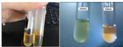
شکل ۵. آزمایش مثبت کرایوگلوبولین

بایستی با قرار دادن در حرارت ۳۷ درجه سانتیگراد محلول گردد