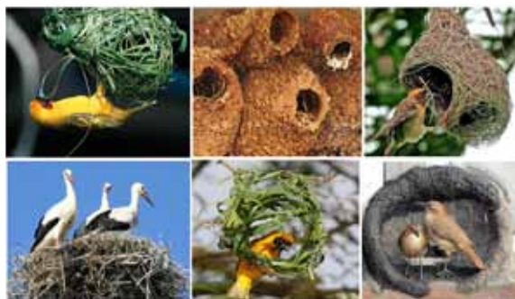
نگاره ۲: گونه های متفاوت لانه سازی پرندگان به عنوان نمودی از تغییرات اپی ژنتیک

بنابراین، اپی ژنتیک رفتاری بر این باور است که تفاوت های فردی در شخصیت و رفتار را می توان ناشی از تثبیت و ویژگی های اکتسابی هر چند در زمانی طولانی در ژن ها دانست. از این روی، بررسی حاضر بر آن شد تا با توجه به دیدگاه های اپی ژنتیکی موجود به واشکافی این موضوع بپردازد که آیا ممکن است ویژگی های خلقی/ رفتاری همچون شادکامی و خشونت، که می توان از آن ها بیشتر به عنوان ویژگی های اکتسابی افراد در طول دوران های تکامل یاد کرد، به نسل های آینده به ارث برسند؟