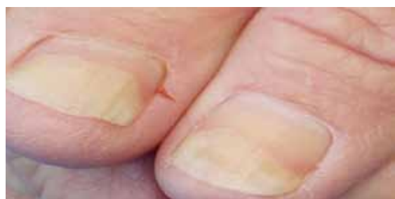
تصویر شماره ۶- اونیکولیز لبه دیستال ناخن

جلوگیری از بارداری هستند. تماس با مواد شیمیایی، خیس خوردگی به علت غوطه وری طولانی مدت در آب، درماتیت تماسی آلرژیک می توانند از علل دیگر اونیکولیز باشند. بین علت های سیستمیک برای اونیکولیز می توان به کم خونی و برونشکتازی اشاره نمود. غیر از پسوریازیس که درگیری شناخته شده ای در اونیکولیز دارد، لیکن پلان هم می تواند باعث اونیکولیز شود. تا ۵۰ درصد از بیماران مبتلا به پسوریازیس درگیری ناخن دارند. در پسوریازیس ناخن، ممکن است علاوه بر اونیکولیز، نقطه نقطه های فرورفته (pitting) و لکه های زرد رنگ شفاف زیر ناخن دیده شود. بیماران مبتلا به اونیکولیز باید از نظر هیپرتیروئیدیسم بررسی شوند.