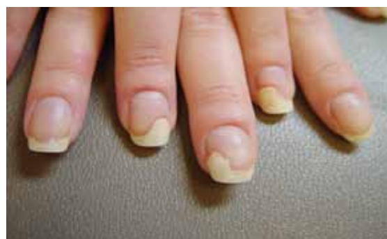
تصویر شماره ۸- اونیکولیز ناشی از ضربه در انگشتان دست