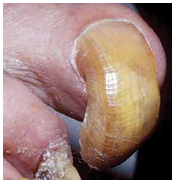
تصویر شماره ۱۰: اونیکوگریفوز ناخن شست پا

هیپرتروفی ناخن به معنی ضخیم شدن و افزایش طول ناخن است در حالی که اونیکوگریفوز به معنی خمیدگی ناخن و نیز مشابه شاخ قوچ شدن است. درمان مشکل بوده و می تواند رادیکال یا تسکینی باشد. در اشخاص مسن درمان تسکینی ارجح است و شامل بریدن منظم ناخن های گرفتار است که معمولاً توسط متخصص یا استفاده از ناخن گیر و سوهان یا یک اهر ماشینی بریده می شود. با شیوع کمتر، ناخن توسط بافت جوانه گوشتی حاصل از بستر ناخن در بر گرفته می شود و قطع آن سبب درد و خونریزی می گردد. در اشخاص جوان تر، ناخن ممکن است هر بار که رشد می نماید با عمل جراحی برداشته شود.