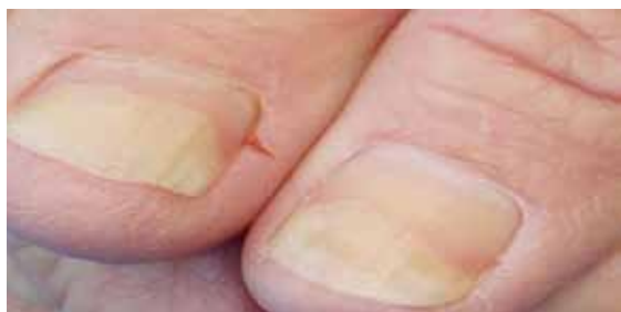
تصویر شماره ۶- اونیکولیز لبه دیستال ناخن

جلوگیری از بارداری هستند. تماس با مواد شیمیایی، خیس خوردگی به علت غوطه وری طولانی مدت در آب، درماتیت تماسی آلرژیک می توانند از علل دیگر اونیکولیز باشند. بین علت های سیستمیک برای اونیکولیز می توان به کم خونی و برونشکتازی اشاره نمود. غیر از پسوریازیس که درگیری شناخته شده ای در اونیکولیز دارد، لیکن پلان هم می تواند باعث اونیکولیز شود. تا ۵۰ درصد از بیماران مبتلا به پسوریازیس درگیری ناخن دارند. در پسوریازیس ناخن، ممکن است علاوه بر اونیکولیز، نقطه نقطه های فرورفته (pitting) و لکه های زرد رنگ شفاف زیر ناخن دیده شود. بیماران مبتلا به اونیکولیز باید از نظر هیپرتیروئیدیسم بررسی شوند.