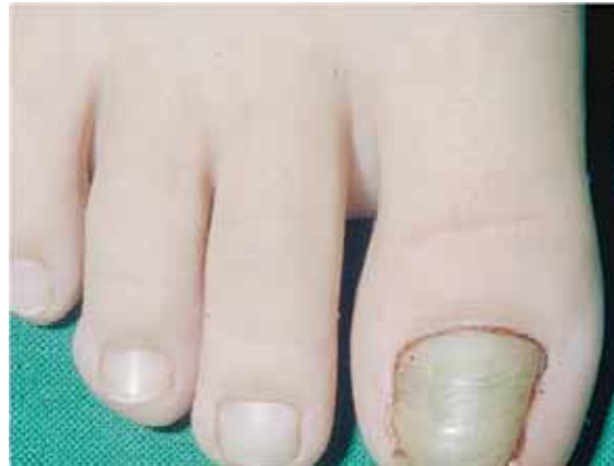
تصویر شماره ۱۳: هایپرتروفی ناخن شست پا