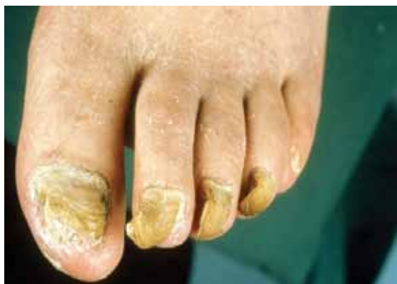
تصویر شماره ۱۱: اونیکوگریفوز ناخن های پا

ترومای بیشتری در نتیجه کفش بر آن ها وارد می شود و آسیب حاصله فزون تر می گردد.