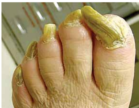
تصویر شماره ۱۲: اونیکوگریفوز ناخن های پا

هیپرتروفی ناخن به معنی ضخیم شدن و افزایش طول ناخن است در حالی که اونیکوگریفوز به معنی خمیدگی ناخن و نیز مشابه شاخ قوچ شدن است. درمان مشکل بوده و می تواند رادیکال یا تسکینی باشد. در اشخاص مسن درمان تسکینی ارجح است و شامل بریدن منظم ناخن های گرفتار است که معمولاً توسط متخصص یا استفاده از ناخن گیر و سوهان یا یک اهر ماشینی بریده می شود. با شیوع کمتر، ناخن توسط بافت جوانه گوشتی حاصل از بستر ناخن در بر گرفته می شود و قطع آن سبب درد و خونریزی می گردد. در اشخاص جوان تر، ناخن ممکن است هر بار که رشد می نماید با عمل جراحی برداشته شود.