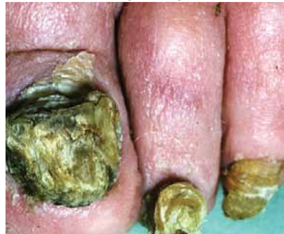
تصویر شماره ۹: اونیکوگریفوز ناخن های پا

عفونت قارچی و برخی بیماری ها از قبیل دیابت و نیز بیماری عروق محیطی ایجاد می شود.