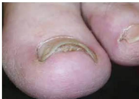
تصویر شماره ۲- انتهای آزاد برآمده و شبیه به نیمه ماه، (اونیکولیز و هایپرکراتوز زیر ناخن)