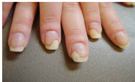
تصویر شماره ۸- اونیکولیز ناشی از ضربه در انگشتان دست