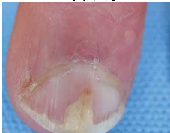
تصویر شماره ۵- اونیکولیز ناشی از ضربه