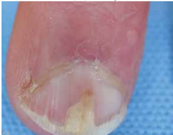
تصویر شماره ۵- اونیکولیز ناشی از ضربه