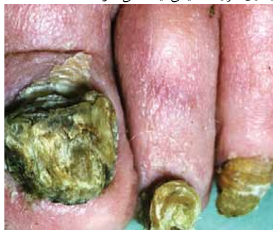
تصویر شماره ۹: اونیکوگریفوز ناخن های پا

عفونت قارچی و برخی بیماری ها از قبیل دیابت و نیز بیماری عروق محیطی ایجاد می شود.