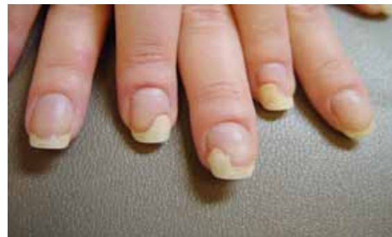
تصویر شماره ۸- اونیکولیز ناشی از ضربه در انگشتان دست