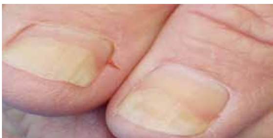
تصویر شماره ۶- اونیکولیز لبه دیستال ناخن

جلوگیری از بارداری هستند. تماس با مواد شیمیایی، خیس خوردگی به علت غوطه وری طولانی مدت در آب، درماتیت تماسی آلرژیک می توانند از علل دیگر اونیکولیز باشند. بین علت های سیستمیک برای اونیکولیز می توان به کم خونی و برونشکتازی اشاره نمود. غیر از پسوریازیس که درگیری شناخته شده ای در اونیکولیز دارد، لیکن پلان هم می تواند باعث اونیکولیز شود. تا ۵۰ درصد از بیماران مبتلا به پسوریازیس درگیری ناخن دارند. در پسوریازیس ناخن، ممکن است علاوه بر اونیکولیز، نقطه نقطه های فرورفته (pitting) و لکه های زرد رنگ شفاف زیر ناخن دیده شود. بیماران مبتلا به اونیکولیز باید از نظر هیپرتیروئیدیسم بررسی شوند.