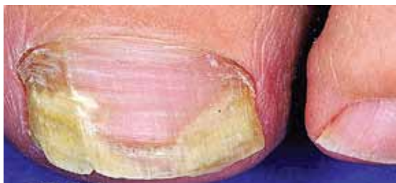
تصویر شماره ۳- اونیکولیز انتهای آزاد و لبه های جانبی ناخن