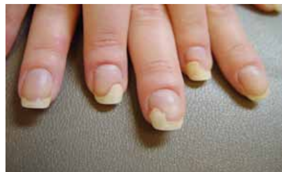
تصویر شماره ۸- اونیکولیز ناشی از ضربه در انگشتان دست