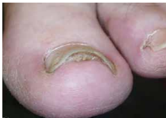
تصویر شماره ۲- انتهای آزاد برآمده و شبیه به نیمه ماه، (اونیکولیز و هایپرکراتوز زیر ناخن)