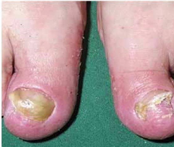
تصویر شماره ۱۴: هایپرتروفی همراه با دفرمیتی در ناخن شست پا