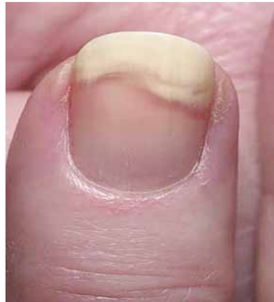
تصویر شماره ۷- اونیکولیز

تشخیص اونیکولیز به کمک مشاهده فیزیکی و همچنین آزمایش های لابراتواری است. از دبری های زیر ناخن نمونه برداری کرده و آزمایش مستقیم میکروسکوپی با پتاس و کشت از نظر قارچ انجام می شود. آزمایش پتاس به تشخیص سریع عفونت ناخن در اونیکولیز کمک می کند.