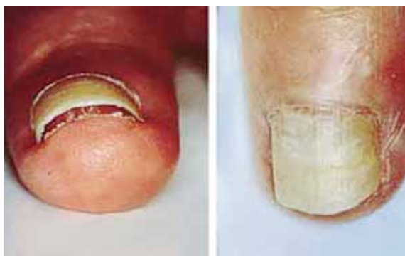
تصویر شماره ۱- انتهای آزاد ناخن برآمده شده است

جلوگیری از بارداری هستند. تماس با مواد شیمیایی، خیس خوردگی به علت غوطه وری طولانی مدت در آب، درماتیت تماسی آلرژیک می توانند از علل دیگر اونیکولیز باشند. بین علت های سیستمیک برای اونیکولیز می توان به کم خونی و برونشکتازی اشاره نمود. غیر از پسوریازیس که درگیری شناخته شده ای در اونیکولیز دارد، لیکن پلان هم می تواند باعث اونیکولیز شود. تا ۵۰ درصد از بیماران مبتلا به پسوریازیس درگیری ناخن دارند. در پسوریازیس ناخن، ممکن است علاوه بر اونیکولیز، نقطه نقطه های فرورفته (pitting) و لکه های زرد رنگ شفاف زیر ناخن دیده شود. بیماران مبتلا به اونیکولیز باید از نظر هیپرتیروئیدیسم بررسی شوند.