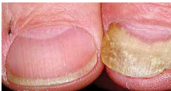
تصویر شماره ۴- اونیکولیز پیشرفته که بیشتر سطح ناخن را درگیر کرده است