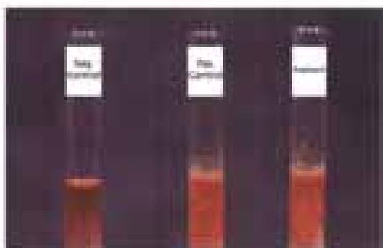
مشاهده رسوب هموگلوبین در ایزوپروپانول ۱۷ درصد از آزمایش‌های تشخیصی برای هموگلوبین‌های ناپایدار می‌باشد

برخی از واریانت‌های ناپایدار \beta چنان ناپایدار هستند که به سرعت از بین رفته و تنها مطالعه DNA قادر به تشخیص آن‌ها می‌باشد. آزمایش‌های رسوب هموگلوبین در ایزوپروپانول ۱۷٪ و تست حرارتی از آزمایش‌های اسکرین تشخیص هموگلوبین‌های ناپایدار هستند. هموگلوبین‌های ناپایدار دارای میل ترکیبی کم یا زیاد یا نرمال برای اکسیژن هستند (۵). جهش ناپایدار در یک ژن آلفا با تولید ۵ تا ۲۰٪ هموگلوبین ناپایدار همراه است که علایم بالینی ندارد ولی جهش ناپایدار بتا با تولید ۲۰ تا ۴۰ درصد هموگلوبین ناپایدار علایم دار می‌شود.