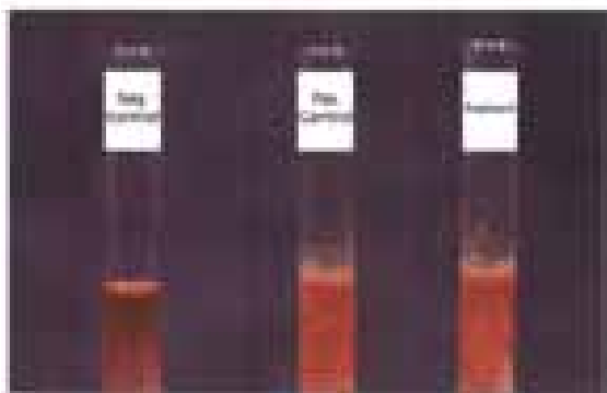
مشاهده رسوب هموگلوبین در ایزوپروپانول ۱۷ درصد از آزمایش‌های تشخیصی برای هموگلوبین‌های ناپایدار می‌باشد

برخی از واریانت‌های ناپایدار \beta چنان ناپایدار هستند که به سرعت از بین رفته و تنها مطالعه DNA قادر به تشخیص آن‌ها می‌باشد. آزمایش‌های رسوب هموگلوبین در ایزوپروپانول ۱۷٪ و تست حرارتی از آزمایش‌های اسکری‌ن تشخیص هموگلوبین‌های ناپایدار هستند. هموگلوبین‌های ناپایدار دارای میل ترکیبی کم یا زیاد یا نرمال برای اکسیژن هستند (۵). جهش ناپایدار در یک ژن آلفا با تولید ۵ تا ۲۰٪ هموگلوبین ناپایدار همراه است که علایم بالینی ندارد ولی جهش ناپایدار بتا با تولید ۲۰ تا ۴۰ درصد هموگلوبین ناپایدار علایم دار می‌شود.