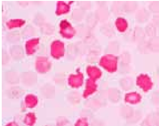
پخش غیر یکنواخت هموگلوبین F در تالاسمی دلتا بتا

آزمایش بتکه که شیوه پخش هموگلوبین F را در گلبول‌ها نشان می‌دهد می‌توان این دو حالت را از هم افتراق داد. در تالاسمی دلتا بتا پخش غیر یکنواخت و در HPFH پخش یکنواخت مشاهده می‌شود.