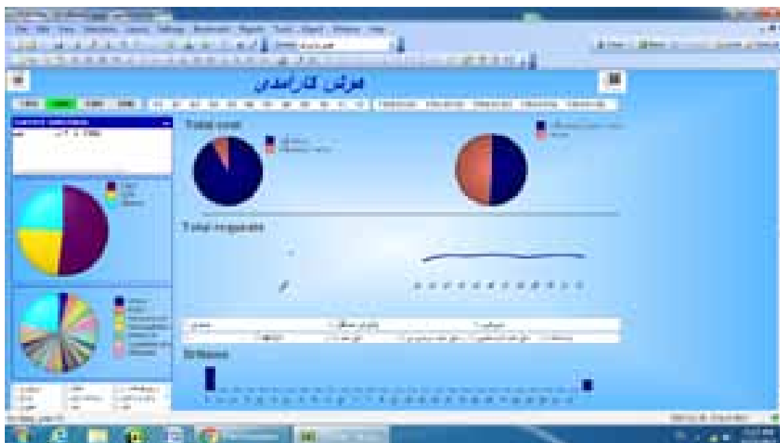
شکل ۲: عملکرد آزمایشگاه و تیم بالینی بر محور بیمار ۱

داشبوردهای ارائه شده در شکل‌های (۵ و ۴ و ۳ و ۲) عملکرد آزمایشگاه و تیم بالینی بر محور بیمار را در سال ۱۳۹۴، ۱۳۹۵ و ۱۳۹۶ نشان می‌دهند.