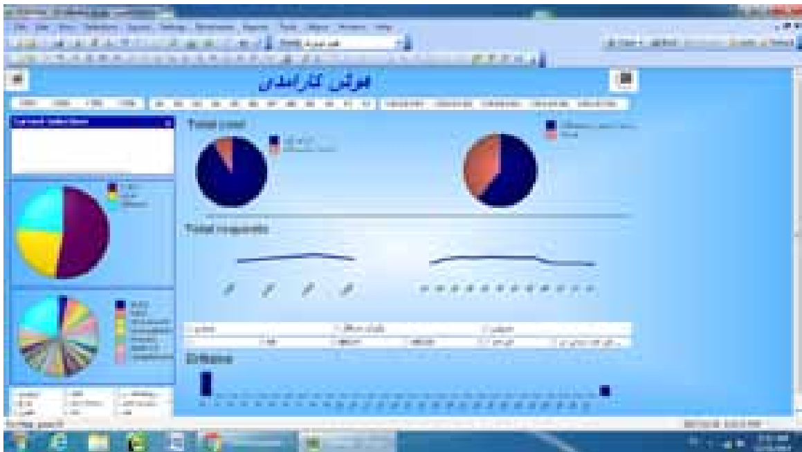
شکل ۵: عملکرد آزمایشگاه و تیم بالینی بر محور بیمار ۴

از آزمایش‌ها، شمارش خون کامل (CBC) است. اگر چه در برخی موارد تعداد این آزمایش‌ها به عنوان بخشی از فعالیت‌های پزشکی مورد نیاز هستند (۴). برخی از آزمایش‌ها می‌توانند چندین بار درخواست داده شوند؛ زیرا تغییرات در این نوع آزمایش‌ها می‌تواند سریع رخ بدهد و نتایج آن‌ها بر درمان سریع پزشکی تأثیر گذار است. مانند تعداد پلاکت‌ها، HB، WBC، گلوکز و ... (۳). همان‌طور که نتایج برخی از مطالعات نشان داده است، حدود ۴۲٫۸٪ از آزمایش‌های درخواست شده غیر ضروری هستند. معیار فراوانی آزمایش‌ها معمولاً Subjective هستند که در بیشتر موارد براساس ضوابط قراردادی مانند روزانه، هفتگی و یا در موارد خاصی انجام می‌شود ولی براساس راهنمای عمومی آزمایش‌ها نباید بدون برنامه استفاده از آن‌ها درخواست داده شوند. زیرا انجام آزمایش‌ها در هزینه بخش آزمایشگاه و بیمارستان تأثیر گذار است (۴). در گذشته آزمایشگاه‌ها به منظور افزایش درآمد، تشویق به انجام آزمایش‌های بیشتر می‌شدند اما در دهه‌های اخیر با افزایش هزینه‌های بیمارستان، آزمایشگاه‌ها تنها ملزم به انجام آزمایش‌های ضروری شده‌اند. از جمله اهداف برنامه‌های بهره‌وری آزمایشگاه که به دنبال صرفه‌جویی در هزینه‌های آزمایشگاه است، جلوگیری از تعداد اشتباه آزمایش‌ها