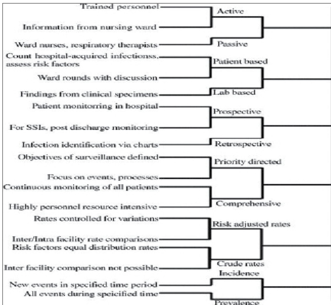
شکل ۲- کارگروه یکپارچه پیشنهاد شده برای نظارت عفونت‌های بیمارستانی در هر بیمارستان