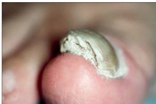
کچلی ناخن همراه با هایپرکراتوز قابل توجه

این فرم که به لکونیشیای قارچی نیز موسوم است نیز نادر بوده و غالباً ناخن‌های بزرگ پا را مبتلا می‌سازد. در صفحه ناخن لکه سفید رنگ کدری ظاهر می‌شود. این لکه در ابتدا نقطه‌ای بوده اما با گسترش عفونت تمامی سطح ناخن را در برمی‌گیرد. در این شکل از کچلی ناخن، برعکس فرم زیر ناخن، میسلیم به بالاترین قسمت صفحه ناخن محدود گشته و به‌ندرت قارچ به لایه‌های عمقی‌تر تهاجم دارد. میسلیم‌های قارچی در این شکل از ضایعه پهن‌تر و بزرگ‌تر از میسلیم‌هایی دیده می‌شود که در شکل کچلی زیر ناخن وجود دارد و در اینجا میسلیم‌ها به اشکالی شبیه استخوان‌های مچ دست مشاهده می‌شوند. این شکل از میسلیم‌ها در قارچ‌های خاکری و در درماتوفیت‌ها هنگام استفاده ساپروفیتی از کراتین دیده می‌شوند. توده‌های هائیفی کج و معوج و آرتروکونیدی‌های با اشکال نامنظم اغلب در حالات ساپروفیتیک قارچ دیده می‌شوند و همانطور که گفته شد این اشکال بر خلاف شکل آن‌ها در کچلی زیر ناخن می‌باشد.