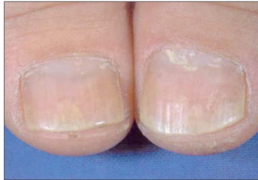
تینا اونگیوم در تشخیص افتراقی با ناخن پسوریاتیک

ناخن‌های دست اثرات درمانی بهتری دارند و این اثر برای گریزوفولوین حدود ۸۰ درصد می‌باشد.