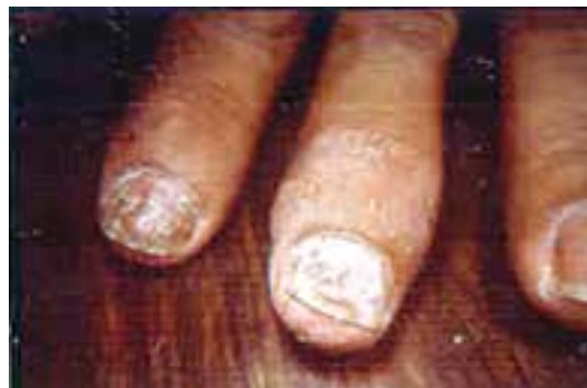
پسوریازیس ناخن با درگیری مفصلی