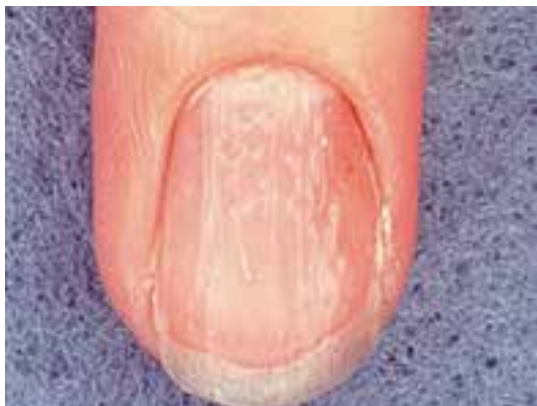
ناخن نقطه نقطه شده (pitting) در پسوریازیس