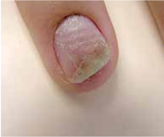
اونیکولیز و هایپرکراتوز زیر ناخن همراه با خرد شدن صفحه ناخن