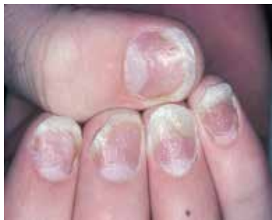
سوراخ سوراخ شدن و اونیکولیز صفحه ناخن