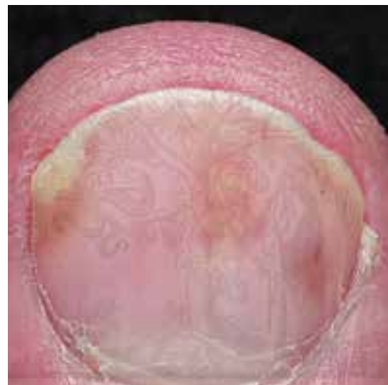
ضایعه لکه روغنی پسوریازیسی