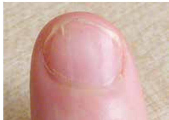
حالت سوراخ شدن و اونیکولیز خفیف