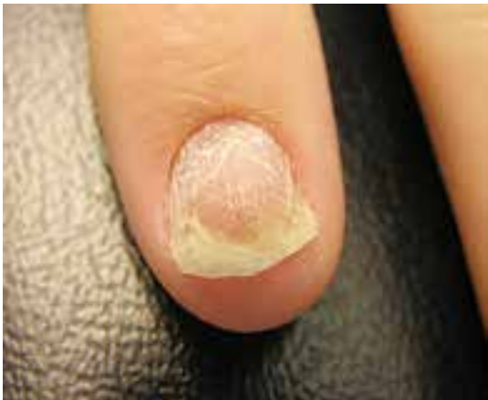
خرد شدن و اونیکولیز صفحه ناخن