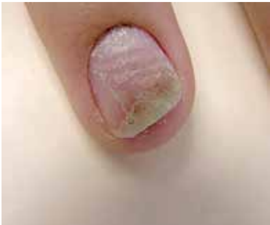
اونیکولیز و هایپرکراتوز زیر ناخن همراه با خرد شدن صفحه ناخن