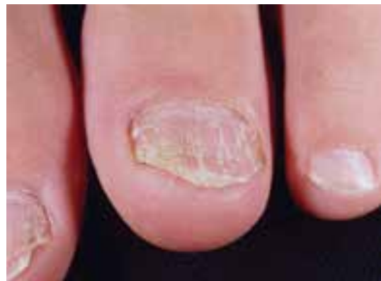
شل شدن و خرد شدن پسوریازیزی صفحه ناخن