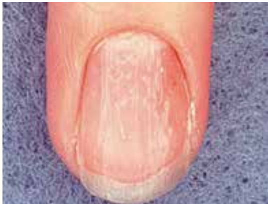
ناخن نقطه نقطه شده (pitting) در پسوریازیس