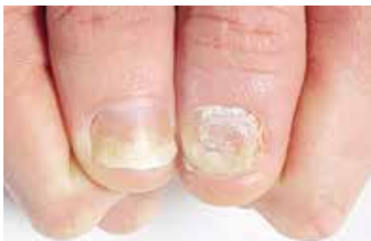
اونیکولیز و خرد شدن صفحه ناخن

سیستمیک بیماری با متوترکسات ضایعات ناخن را بهبود می‌دهد در حالی که رشد آن کم می‌شود. درمان‌هایی مثل آستروئید موضعی، تزریق آستروئید داخل ماتریکس، مصرف ۵-فلورواوراسیل موضعی و ۱٪ PUVA، رتینوئیدهای خوراکی، سیکلوسپورین موضعی و در موارد محدودی رادیوتراپی برای پسوریازیس ناخن به کار می‌روند ولی احتمال موفقیت کم و میزان عود بالاست.