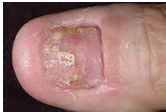
حالت شل شدن، خرد شدن و سوراخ شدن در صفحه ناخن پسوریازیسی