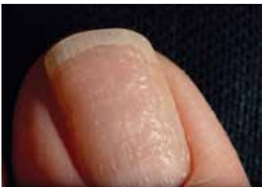
فرورفتگی های منقوط پسوریازیسی