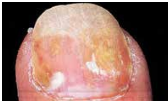
ضایعه لکه روغنی پسوریازیس. انباشت بقایای پاراکراتوتیک و سرم در زیر ناخن باعث ایجاد رنگ زرد مایل به قهوه‌ای در زیر ناخن می‌شود