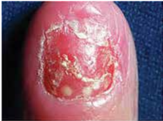
پسوریازیس پوسچولار ناخن