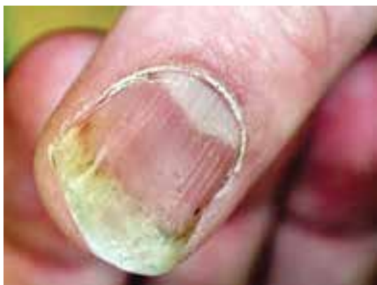
فرورفتگی‌های منقوط و اونیکولیز در پسوریازیس ناخن. التهاب پسوریازیس پوست نوک انگشت سبب جدا شدن قسمت دیستال صفحه ناخن شده و این تصویر می‌تواند کاملاً مشابه اونیکولیز ناشی از تروما باشد