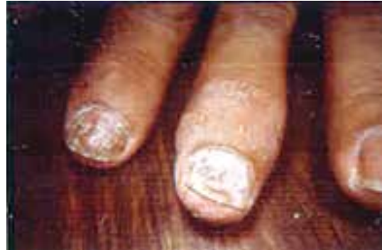
پسوریازیس ناخن با درگیری مفصلی