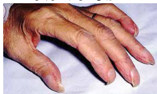
Distal notch در لیکن پلان

این بیماری علاوه بر پوست و ناخن، ممکن است مخاط دهان