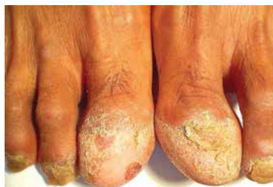
دیستروفی ناخن در لیکن پلان