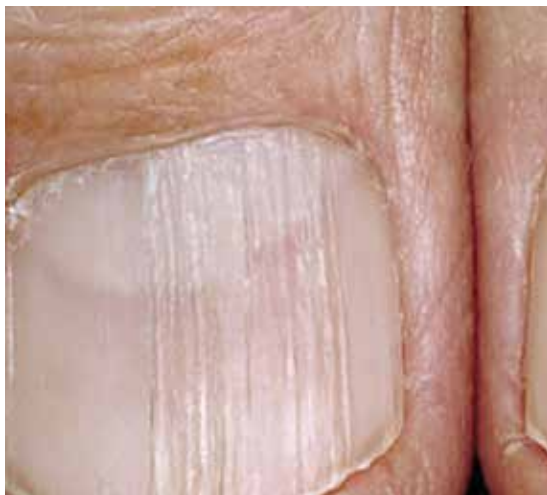
خطوط و شیارهای طولی در لیکن پلان ناخن

در مطالعه بافت شناسی مشخص می‌شود که آسیب وارده بر ناخن در لیکن پلان، در ناحیه ماتریکس واقع است و هنگامی که اسکار پدید می‌آید مشابه اسکار لیکن پلان در اطراف ریشه‌های مو است. Zaias نشان داد که تشکیل ناخنک در اثر به هم چسبیدن بین اپیدرم چین ناخنی دورسال و بستر ناخن است. او همچنین گفت که لیکن پلان بستر ناخن ممکن است منجر به هیپرپیگمانتاسیون، هیپرکراتوز زیر ناخن و اونیکولیز گردد. لیکن پلان ناخن بدون مدارکی از لیکن پلان در سایر قسمت‌های بدن نیز اتفاق می‌افتد. لیکن پلان در دوران کودکی شایع نیست.