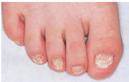
لیکن پلان در ناخن‌های پا در اطفال

در بین بیمارانی که درگیری پوستی دارند بیش از نیمی از آنان ابتلاء مخاط دهانی را نیز نشان می‌دهند. لژیون‌های مخاطی بدون لژیون‌های پوستی در ۱۵ تا ۲۵ درصد موارد لیکن پلان دیده می‌شود. شایع‌ترین نوع ضایعات مخاط دهان خطوط ویکهام (wickham) هستند که در مخاط بوکال و لب‌ها دیده می‌شود و معمولاً دو طرفه هستند و ممکن است بیماران از حضور آن‌ها آگاهی نداشته باشند.