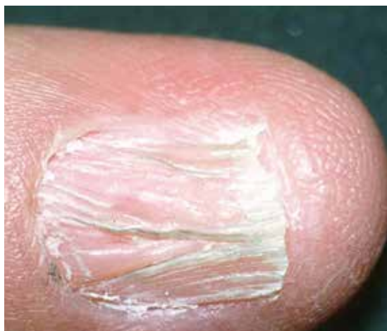
چین خوردگی و نازک شدن صفحه ناخن