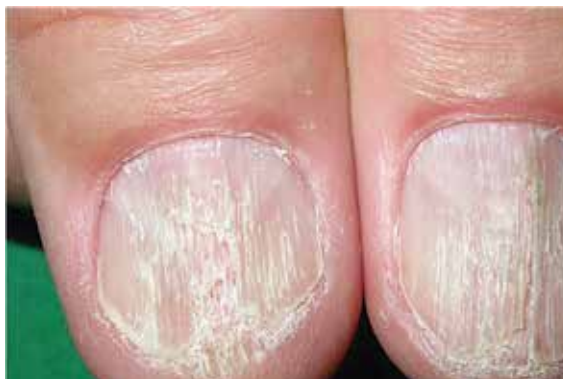
تغییرات تیبیک در لیکن پلان ناخن‌ها