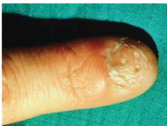
نمای دیستروفیک در لیکن پلان ناخن