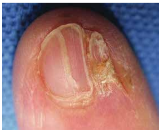
ایجاد شکاف و نازک شدن صفحه ناخن