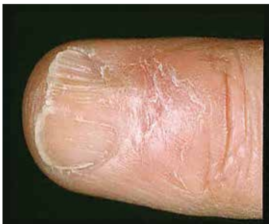
خطوط شیاری در سطح صفحه ناخن