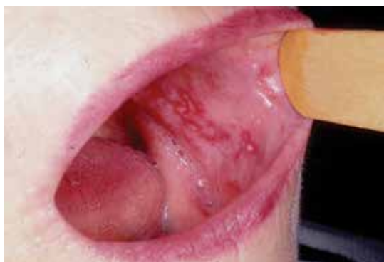
ضایعات مخاطی داخل گونه‌ها در لیکن پلان دهان

درمان لیکن پلان معمولاً با استفاده از کورتون موضعی و گاهی نیز آستروئید خوراکی انجام می‌شود، هرچند که درمان‌های دیگری نیز وجود دارد. لیکن پلان مخاط معمولاً درمان سخت‌تر و طولانی‌تری دارد. نکته مهم آن است که لکه‌های ناشی از بیماری ممکن است تا مدت‌ها باقی بماند و در حدود یک پنجم از بیماران، بیماری عود می‌کند.