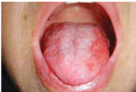
ضایعات مخاطی لیکن پلان در دهان

و ناحیه تناسلی را نیز درگیر کند. لیکن پلان اغلب با معاینه بالینی تشخیص داده می‌شود. اما در موارد مشکوک می‌توان از بیوپسی پوست یا مخاط برای تأیید تشخیص استفاده کرد.