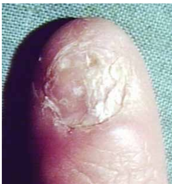
نمای دیستروفیک در لیکن پلان ناخن