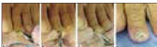
شکل ۲- روش تراشیدن و کندن لبه دیستال ناخن و جمع آوری دبری‌ها و نسج هیپرکراتوز زیر ناخن

انتخاب محل مناسب از ناخن برای نمونه گیری بستگی به این دارد که کدام پاتوزن احتمالی مورد شک قرار می‌گیرد. در نواحی گرمسیری به احتمال بیشتر قارچ‌های کپکی موجب اونیکومایکوز می‌شوند. بنابراین در صورتی که مشکوک به حضور احتمالی این گونه از قارچ‌ها به عنوان عامل اونیکومایکوزیس باشیم، صفحه ناخن (nail plate)، بستر ناخن (nail bed) و دبری‌های زیر صفحه ناخن (subungual debris) نمونه‌های بهتری را برای کشت فراهم می‌کنند. اگر به کاندیدا مشکوک باشیم بهتر است نمونه را از گوشه‌های پروکسیمال و جانبی (lateral) ناخن تهیه کرد. استفاده از تکنیک‌های آسپتیک از رشد زیاده از حد (overgrowth) میکروارگانیسم‌های آلوده کننده جلوگیری می‌کنند زیرا این عوامل ممکن است رشد قارچ‌های پاتوزن را سرکوب کنند.