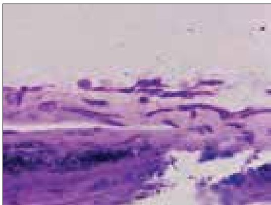
اونیکومایکوز ناشی از فوزاریوم رنگ آمیزی PAS

و رنگ آمیزی رسوب حاصل از آن با PAS یا رنگ آمیزی فلئورسنت و یا استفاده از رنگ (Chlorazol Black E) نسبت به آزمایش روتین KOH و کشت از حساسیت بیشتری برخوردار است.