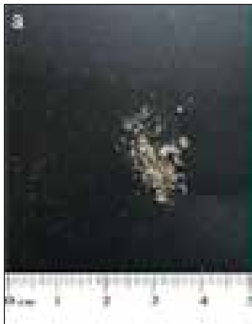
شکل ۳- این شکل حجم کافی نمونه ناخن تراشیده شده را نشان می‌دهد.

یک آزمایش قارچ شناسی برای ناخن برای هر بیمار استفاده شده است انسیدانس آن را در جوامع از ۶/۵ درصد تا ۲۰ درصد و در برخی دیگر بین ۲ تا ۱۸ درصد گزارش کرده‌اند. افزایش سطح آگاهی مردم و درمان‌های در دسترس و جدید یک استراتژی تشخیصی کارآمد را با حساسیت خوب فراهم ساخته است.