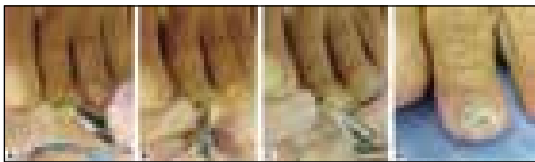
شکل ۲- روش تراشیدن و کندن لبه دیستال ناخن و جمع آوری دبری‌ها و نسج هیپرکراتوز زیر ناخن

انتخاب محل مناسب از ناخن برای نمونه گیری بستگی به این دارد که کدام پاتوزن احتمالی مورد شک قرار می‌گیرد. در نواحی گرمسیری به احتمال بیشتر قارچ‌های کپکی موجب اونیکومایکوز می‌شوند. بنابراین در صورتی که مشکوک به حضور احتمالی این گونه از قارچ‌ها به عنوان عامل اونیکومایکوزیس باشیم، صفحه ناخن (nail plate)، بستر ناخن (nail bed) و دبری‌های زیر صفحه ناخن (subungual debris) نمونه‌های بهتری را برای کشت فراهم می‌کنند. اگر به کاندیدا مشکوک باشیم بهتر است نمونه را از گوشه‌های پروکسیمال و جانبی (lateral) ناخن تهیه کرد. استفاده از تکنیک‌های آسپتیک از رشد زیاده از حد (overgrowth) میکروارگانیزم‌های آلوده کننده جلوگیری می‌کنند زیرا این عوامل ممکن است رشد قارچ‌های پاتوزن را سرکوب کنند.