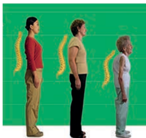
شکل ۲: خمیدگی ستون فقرات به دلیل ضعیف شدن و کاهش تراکم استخوان‌ها (۷)

کلسیم وجود دارد، که شایع‌ترین آن پوکی استخوان (Osteoporosis) است. در این بیماری، استخوان‌ها مواد معدنی مانند کلسیم را از دست می‌دهند و شکننده می‌شوند و راه رفتن را دچار مشکل می‌کنند. بنابراین افرادی که استخوان‌های ضعیفی دارند، بیشتر در معرض خطر شکستگی استخوان، کلاپس مهره‌ها و خمیدگی ستون فقرات هستند. شکستگی استخوان‌ها در ابتدا دردناک نبوده و به راحتی برای افراد قابل تشخیص نیست، که این موضوع تقویت دوباره استخوان‌ها را دچار مشکل می‌کند (شکل ۲).