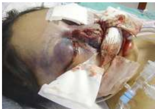
تابلو بالینی زیگومایکوز پیشرفته بینی مغزی (رینوسربرال)

همانطور که گفته شد اگر چه رایزوپوس آریزوس شایع‌ترین عامل زیگومایکوز انسانی است اما گونه‌های دیگر این جنس به اضافه رایزوموکور، آبسیدیا و کانینگهاملا به عنوان عوامل عفونت‌های تهاجمی در بیماران بستری مطرح می‌باشند. زیگومایکوز تهاجمی در بیماران مبتلا به اختلالات سیستم ایمنی اتفاق می‌افتد و علائم کلینیکی آن مشابه آسپرژیلوزیس است. تخمین زده می‌شود که زیگومایکوز در ۱ الی ۹ درصد دریافت کنندگان پیوند ارگان‌های جامد اتفاق می‌افتد. فاکتورهای خطر شامل استفاده از کورتیکوستروئیدها، درمان با دفروکسامین، کتواسیدوز دیابتی، نارسایی کلیوی، بدخیمی‌های هماتولوژیک، سرکوب مغز استخوان و مواجهه با فعالیت‌های عمرانی بیمارستانی می‌باشد.