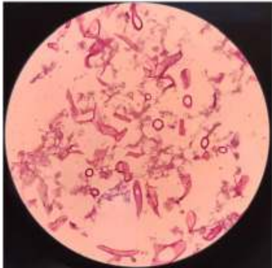
هیستولوژی: مقاطع طولی و عرضی هایفای سنوسیستیک در زیگومایکوز

ارگانسیم در بافت به صورت هایفی بدون دیواره عرضی (coenocytic) یا معمولاً با تیغه‌های عرضی به طور پراکنده، نامنظم و پهن به قطر ۱۵ تا ۲۰ میکرون و با انشعابات جانبی کوتاه و بدون انشعابات دو شاخه‌ای (دیکوتوموس) دیده می‌شود. کشت با کمک سوآب از سینوس‌های عفونی ممکن است منفی باشد. Chandler و همکاران تشکیل کلامیدوکونیدی‌ها در بافت را در ۴ مورد از زیگومایکوز ناشی از آبسیدیا و یا گونه‌های رایزوپوس گزارش کردند. نتیجه منفی کشت از بافت احتمال زیگومایکوز را رد نمی‌کند و یا حتی این احتمال را کاهش نداده یا بی ارزش نمی‌کند. نمونه‌های بافت باید به سرعت با گوموری متنامین سیلور (GMS) و یا همتوکسین - ائوزین (H&E) رنگ آمیزی شوند.