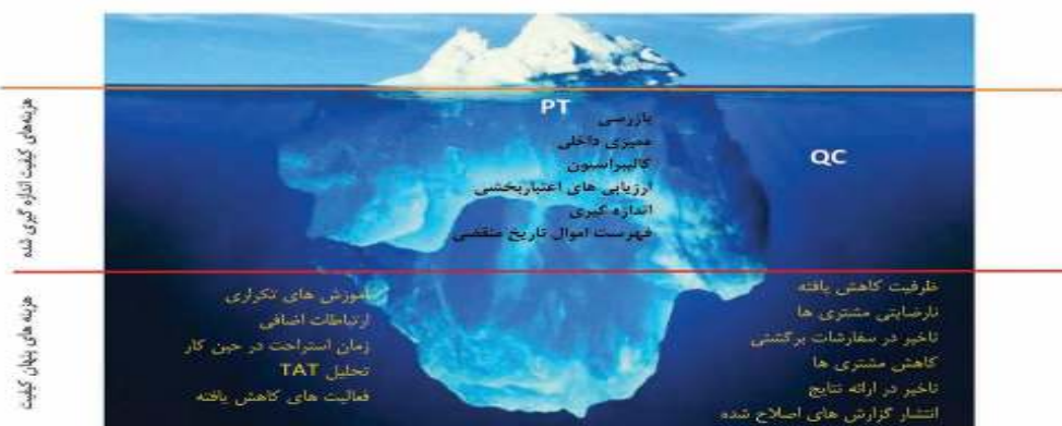
شکل ۷: توده کوه یخ شناور شامل هزینه‌های اندازه‌گیری کیفیت و هزینه‌های پنهان کیفیت

هزینه‌های پنهان کیفیت را که در زیر آب و در قاعده کوه یخ قرار دارد، مرتفع کند. این نوع پروژه‌ها که باید به کاهش یا حذف NCE کمک کند، زمانی مؤثر خواهد بود که اشکالات و نقص‌ها و خطاها به طور معکوس بتواند بودجه‌های صرف شده در این راه را کاهش داده و باعث صرفه جویی در هزینه‌ها شود (جدول ۳) (۳۵،۳۶).