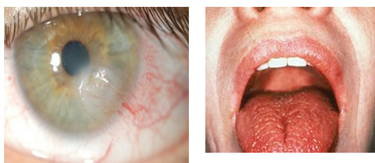
شکل ۱. خشکی چشم و خشکی دهان در سندرم شوگرن

در ارتباط با تشخیص بیماری، یک سری معیارها وجود دارد که اولین معیارها توسط انجمن آمریکایی-اروپایی American European Consensus Group (AECG) در سال ۲۰۰۲ پیشنهاد شد (جدول یک) که مورد استقبال زیاد محققان و پزشکان قرار گرفت و به عنوان استاندارد طلایی جهت تشخیص سندرم شوگرن در نظر گرفته شد (۱۱).