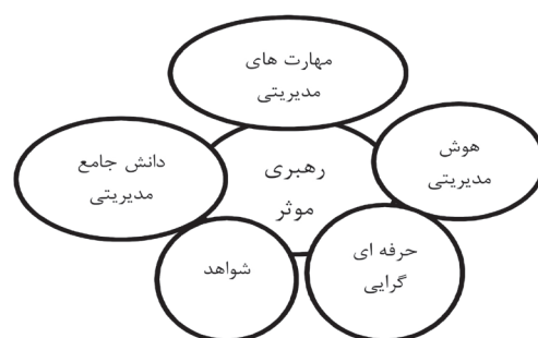
شکل ۱: مدل نهایی رهبری و مدیریت شایستگی

کلیه محورهای شایستگی مدیران نظام سلامت و آزمایشگاه‌های بالینی که در چارچوب MCAP قرار نداشتند از طریق روش کدگذاری باز و استنتاجی حاصل از جدیدترین مطالعات انجام شده در این زمینه استخراج شد تا پس از تأیید پژوهشگران مطالعه مزبور منعکس کننده آخرین یافته‌های رهبری و مدیریت در تعیین شایستگی مدیران ارائه دهنده خدمات در نظام سلامت و نظام ارائه خدمات آزمایشگاهی باشد. محورها و زیرمحورهای انتخاب شده با استفاده از نویسندگان این مقاله از نظر درستی و ثبات بررسی متقاطع یا (Cross-checked) به تأیید رسید و منجر به خلق چارچوب جدیدی از مدل شایستگی مدیران نظام سلامت و آزمایشگاه‌های بالینی انجامید.