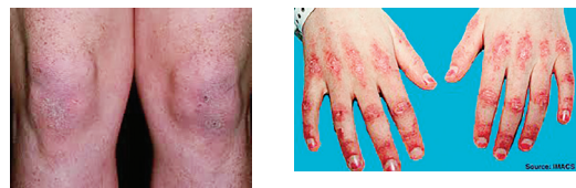
شکل ۲. گاترون پاپول روی مفاصل انگشتان دست و مفاصل زانو