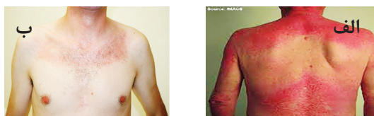
شکل ۳. نشانه shawl و V

شروع تحت حاد، سن بیشتر از ۱۸ سال، ضعف عضلانی پروکسیمال قرینه، حضور rash (هیلوتروب، پائول گاترون، نشانه V، نشانه shawl (شکل سه). فقدان علائم IBM که در جدول ۳ آمده است، حضور آتروفی پری فاسیکولار