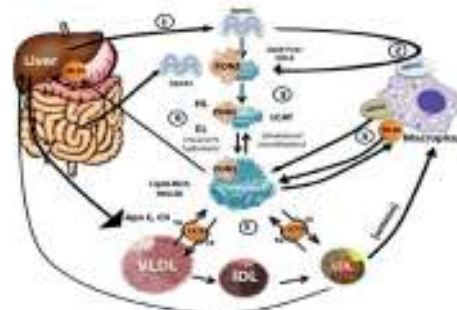
شکل ۳- مکانیسم عمل PON1

به نظر می‌رسد که استاتین‌ها، رونویسی از PON1، را احتمالاً از طریق مکانیسم SREBP-2 افزایش می‌دهند (۶۲) (شکل ۳).