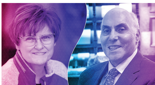
شکل ۱: درو وایزمن و کاتالین کاریکو برندگان جایزه نوبل پزشکی ۲۰۲۳ میلادی