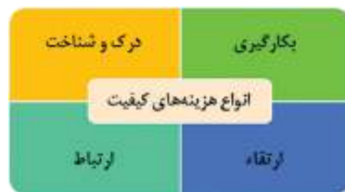
شکل ۱: انواع هزینه‌های کیفیت

COQ شامل روشی است که به وسیله آن آزمایشگاه بالینی می‌تواند شناسایی درستی از انواع مختلف هزینه‌های کیفیت داشته باشد، انواع هزینه‌ها را در بودجه بندی به کار گیرد و بین اطلاعات هزینه کیفیت را با دیگر سازمان‌های بزرگ ارتباط ایجاد کند و استفاده محدود از منابع را ارتقاء دهد. واژه هزینه‌های کیفیت بیانگر انواع مختلف هزینه‌های مرتبط با فرآیند خدمات آزمایشگاهی است، شامل هزینه‌هایی که از کیفیت خوب در آزمایشگاه بالینی حمایت می‌کند و به عنوان هزینه‌های ارزیابی و پیشگیری نیز طبقه‌بندی می‌شوند و هزینه‌هایی که کیفیت خوب را کاهش می‌دهد و به عنوان هزینه‌های نقص‌های داخلی و خارجی معرفی می‌شوند. اجزای COQ در یک آزمایشگاه بالینی در شکل زیر نشان داده شده است: