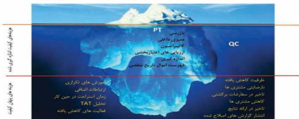
شکل ۷: توده کوه یخ شناور شامل هزینه‌های اندازه‌گیری کیفیت و هزینه‌های پنهان کیفیت

هزینه‌های پنهان کیفیت را که در زیر آب و در قاعده کوه یخ قرار دارد، مرتفع کند. این نوع پروژه‌ها که باید به کاهش یا حذف NCE کمک کند، زمانی مؤثر خواهد بود که اشکالات و نقص‌ها و خطاها به طور معکوس بتواند بودجه‌های صرف شده در این راه را کاهش داده و باعث صرفه جویی در هزینه‌ها شود (جدول ۳) (۳۵،۳۶).