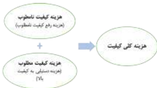
شکل ۲: نمونه‌ای از معادله COQ

هزینه در آزمایشگاه بالینی لازم و ضروری می‌باشد. COQ بیانگر تفاوت بین هزینه واقعی یک محصول یا خدمات با هزینه‌های کاهش یافته است، اما در صورتی که هیچ نوع احتمالی برای ارائه خدمات غیر استاندارد، وجود نقص در تولید محصول و یا نقص در ساخت وجود نداشته باشد. ضرورتاً هر نوع هزینه‌ای که به خاطر کامل بودن کیفیت صرف نشود، مربوط به افزایش COQ می‌شود (۴). به عبارت دیگر، هزینه کلی تولید یک محصول یا ارائه خدمات به منزله بخشی از هزینه‌های دستیابی به کیفیت مطلوب و هزینه‌های مصرف شده برای اصلاح کیفیت نامطلوب است. هزینه واقعی تولید فقط شامل هزینه‌هایی است که از کیفیت مطلوب حمایت می‌کند.