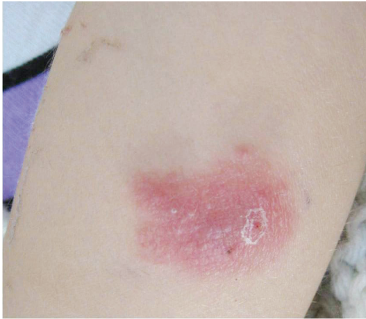
بروز اسپرژیلوزیس جلدی در بیمار بعد از پیوند عضو جامد

می‌کند و نیاز به اصلاح دارد. همچنین تاکید می‌کند که عامل اصلی تعیین کننده وضعیت خالص سرکوب سیستم ایمنی، سرکوب سیستم ایمنی پایدار ("سطح زیر منحنی")، بعوض دوز روزانه است.