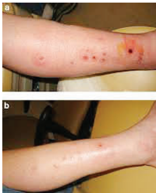
آسپرژیلوزیس جلدی در اثر آسپرژیلوس اوستوس بعد از دریافت پیوند ریه

تقریباً ۱۰٪ از بیمارانی که با آلوگرافت فعال (functioning allograft) تحت درمان سرکوب سیستم ایمنی هستند، در معرض خطر بالای ابتلا به انواع عفونت‌های فرصت طلب، به ویژه عفونت‌های قارچی، قرار دارند. این‌ها بیمارانی هستند که نتیجه پیوند نسبتاً ضعیفی داشته‌اند: عملکرد مرزی عضو آلو گرافت، سرکوب حاد و/یا مزمن سیستم ایمنی بیش از حد و اغلب حضور یک عفونت ویروسی مزمن. این بیمارانی که "همیشه به صورت مزمن بیماری را دارند" (never do well) در معرض خطر بالای ابتلا به عفونت‌های قارچی مانند عفونت‌های ناشی از کریپتوکوکوس نئوفرمانس، گونه‌های آسپرژیلوس، قارچ‌های نوظهور و - در صورت مناسب بودن سابقه اپیدمیولوژیک - عفونت منتشر شده ناشی از هیستوپلاسما کپسولاتوم یا کوکسیدیوئیدس ایمیتیس هستند. پیشگیری در این بیماران نیاز به کاهش درمان سرکوب کننده سیستم ایمنی، نظارت دقیق برای مواجهه‌های احتمالی محیطی، درمان عفونت ویروسی و در نظر گرفتن تجویز پیشگیرانه آزول دارد (اگر چه دستورالعمل‌هایی برای مورد آخر هنوز تدوین نشده است).